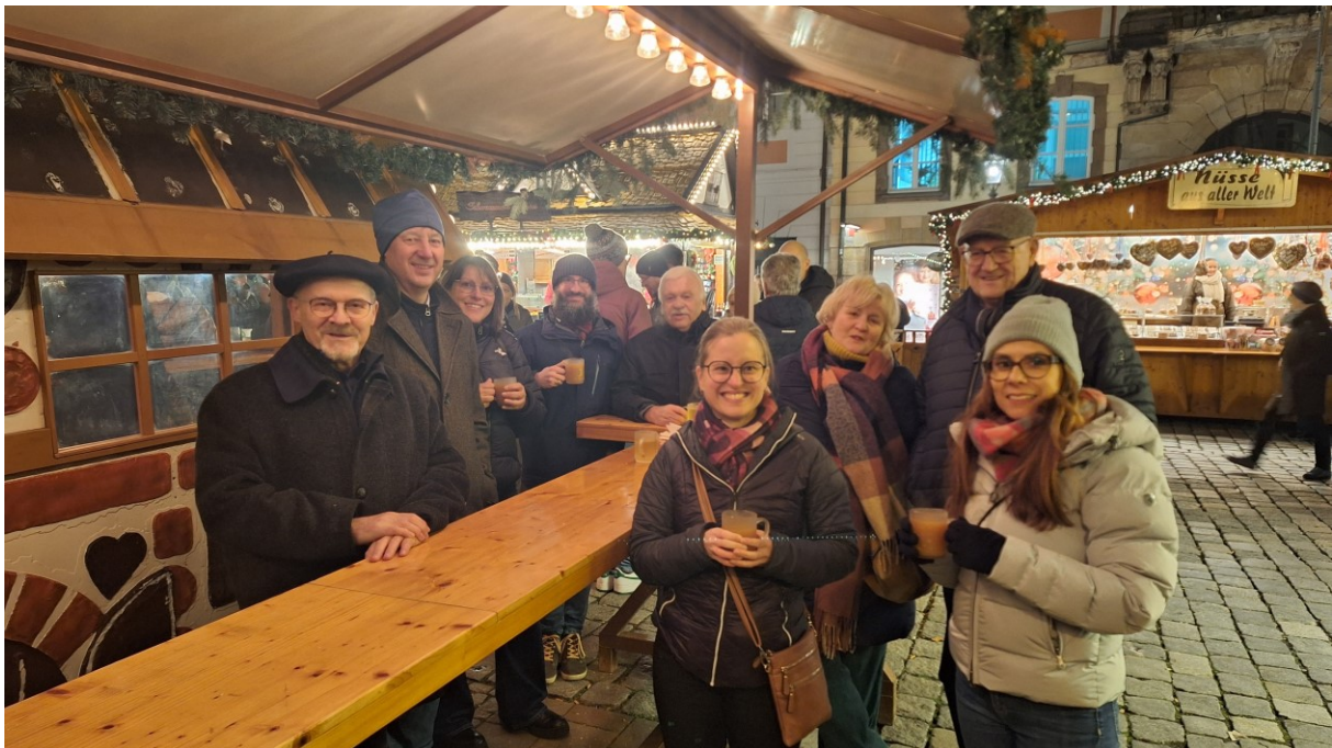
Text und Foto: Katharina Walz

Im Anschluss an den offiziellen Teil stand noch ein gemeinsamer Besuch auf dem Ansbacher Weihnachtsmarkt auf dem Programm. Der Bezirksverband spendierte jedem Teilnehmer einen Glühwein oder Kinderpunsch sowie eine Bratwurstsemmel bzw. eine vegetarische Alternative. Bei guter Unterhaltung und geselligem Austausch wurde besprochen, dass der gemeinsame Weihnachtsmarktbesuch auch im nächsten Jahr wieder stattfinden soll.